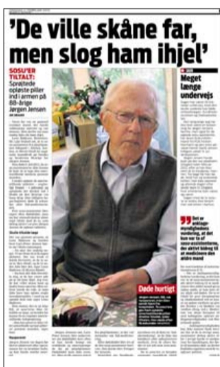
Ekstra Bladet 4. februar i år.

Den 33-årige tiltalte afviser, at hun blev advaret om, at hun stod med en regulær dødsprøje i hænderne. Ifølge hendes forklaring sagde kollegaen blot, at han ikke